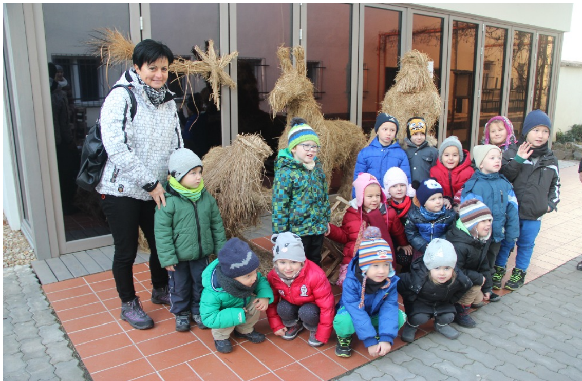
Foto z úspěšných akcí