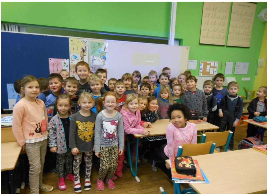
Návštěva v základní škole