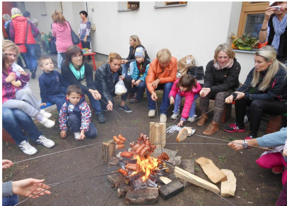
Hrátky s přírodinami