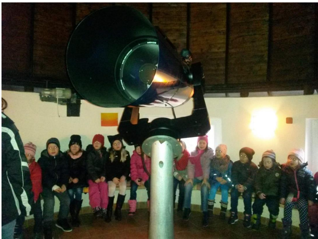
Hvězdárna Veselí nad Moravou