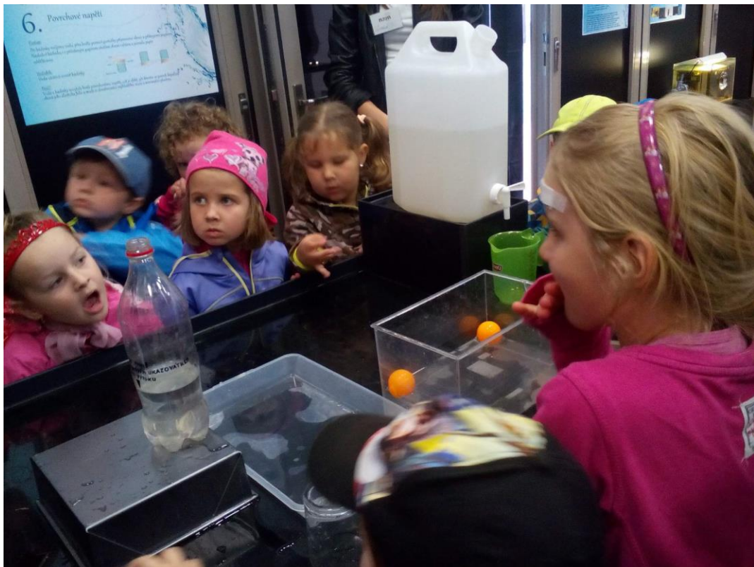
Valtice – muzeum