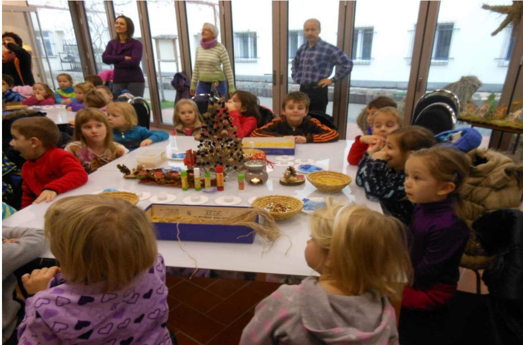
Zemědělské muzeum Valtice