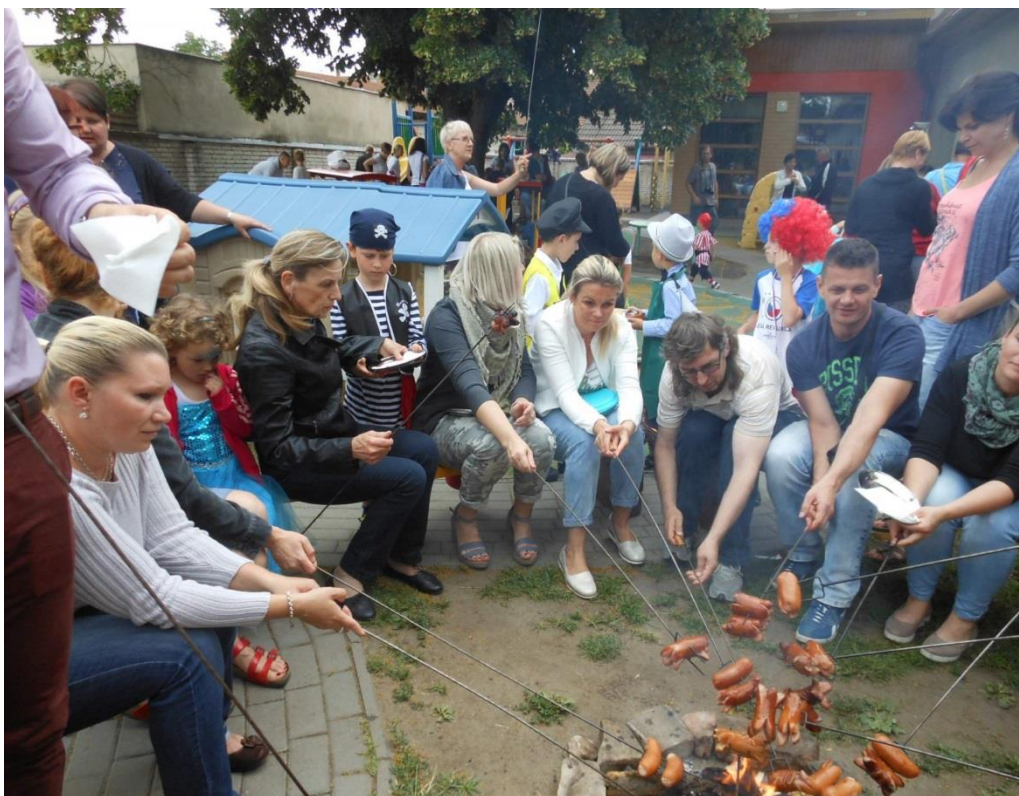
Rozloučení s předškoláky