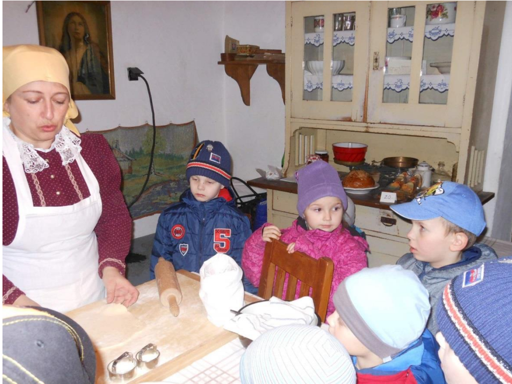
Strážnice – skanzen